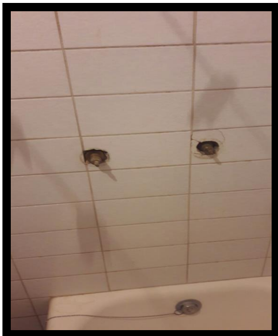
KORAK 1 – ZATEČENO STANJE