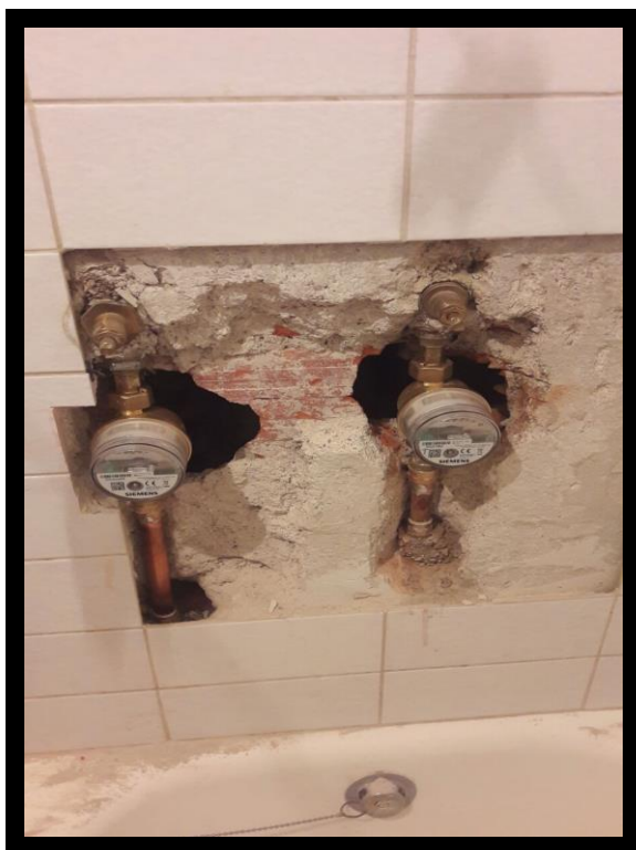
KORAK 3 – UGRAĐENI VODOMJERI