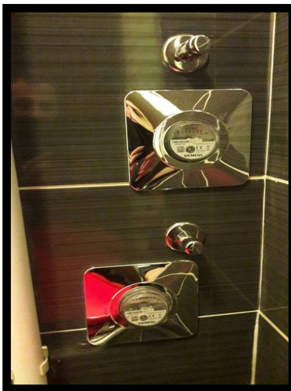
KORAK 4 – IZVEDENO STANJE