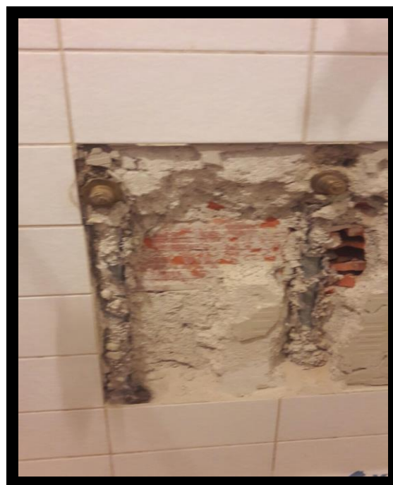
KORAK 2 – ŠTEMANJE ZIDA DO PRISTUPA INSTALACIJI VODE