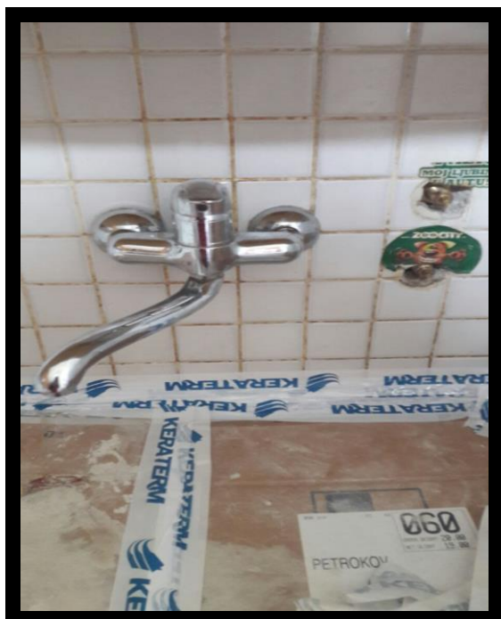
KORAK 1 – ZATEČENO STANJE