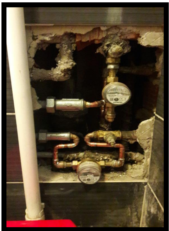
KORAK 3 – UGRAĐENI VODOMJERI