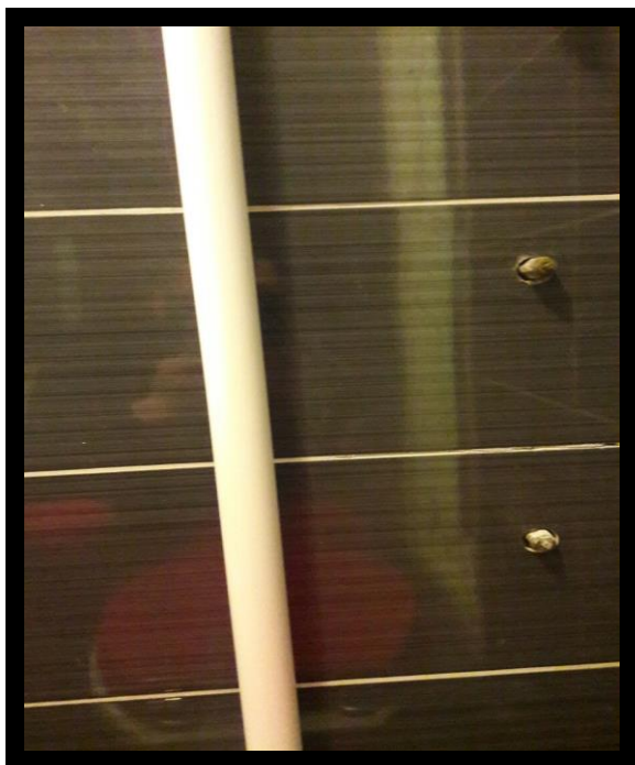
KORAK 1 – ZATEČENO STANJE