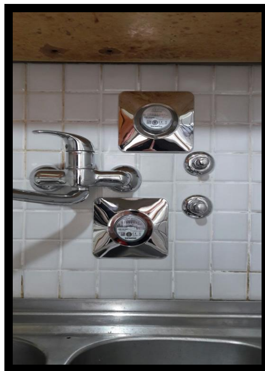
KORAK 4 – IZVEDENO STANJE