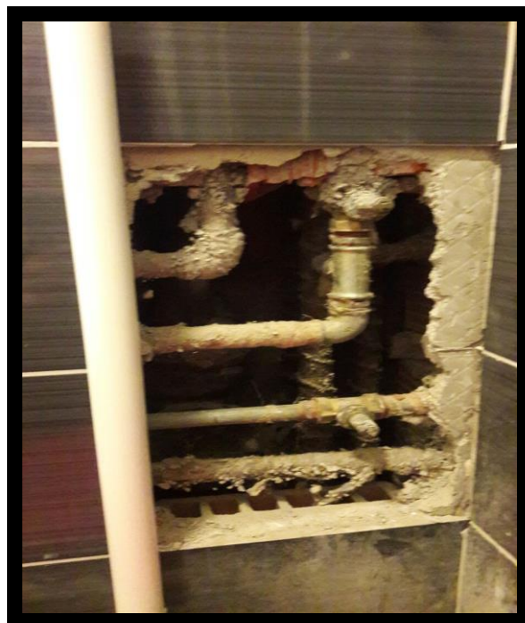
KORAK 2 – ŠTEMANJE ZIDA DO PRISTUPA INSTALACIJI VODE