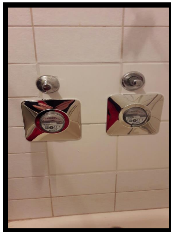
KORAK 4 – IZVEDENO STANJE